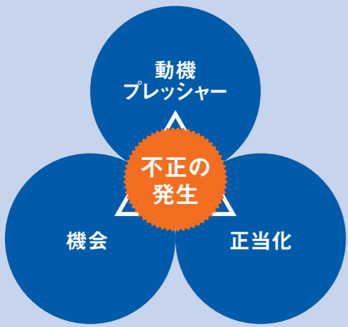
図表2 不正のトライアングル

サラリーマン社会では、上からの命令に背くのは大変難しい。経営陣の号令であればなおさらである。たとえ少々「良心の呵責」があつたにしても、「会社のためだ」と割り切ってしまうケースは少なくない。しかし、それが冒頭に述べたような大きな代償を招くとすれば、平時から「悪いことは悪いと言うべきである」点を従業員に徹底しておくことが肝要だ。経営陣にとつても、自らへの厳しい責任追及を招かぬためにも重要である。この点は、国際的な金融